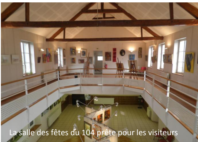
La salle des fêtes du 104 prête pour les visiteurs