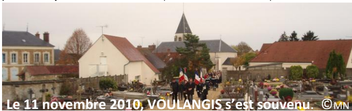
Le 11 novembre 2010, VOULANGIS s'est souvenu.