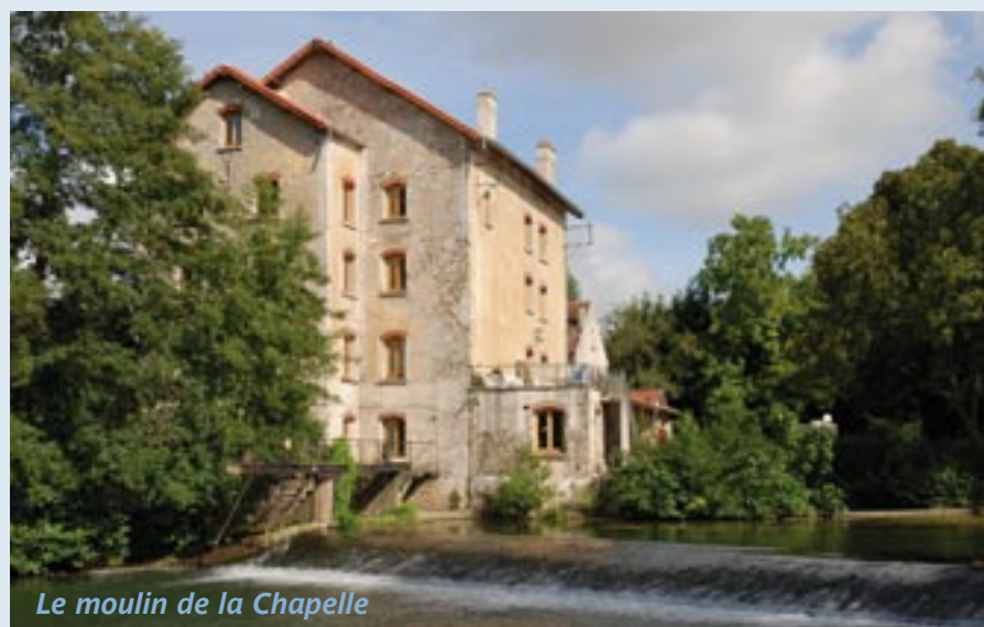
Le moulin de la Chapelle

Cet événement fut l'occasion pour des passionnés du milieu associatif du Pays-Créçois, sensibles au maintien d'une qualité de vie dans un milieu qui aspire encore à la tranquillité, tous férus d'histoire, de mettre à l'honneur « Nos Moulins » entre Tigeaux et Saint-Germain-sur-Morin, soit près de 20 moulins sur quelques kilomètres, alors que le Grand-Morin chemine sur près de 120 kilomètres.