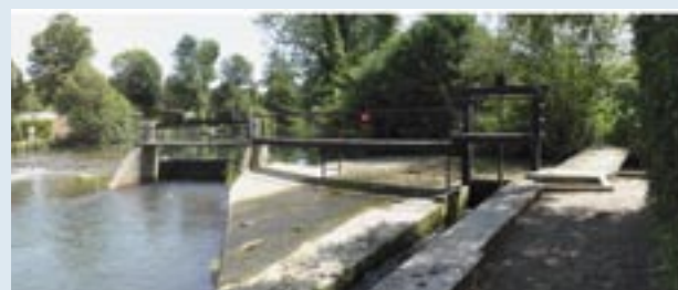
Déversoir, porte à bateau et canal de fuite du moulin Guillaume à Villiers sur Morin

L'Exposition qui se tenait sur les quatre communes que sont Couilly-Pont-aux-Dames, Crécy-La-Chapelle, Saint-Germain-sur-Morin et Villiers-sur-Morin, abordait tous les aspects liés à l'activité des Moulins : leur implantation géographique qui, déterminée judicieusement en fonction de la configuration de la rivière, permettait une réalisation aisée des biefs d'aménée et de décharge, des canaux de fuite,