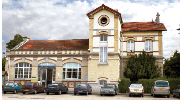
La gare de Saint-Germain-sur-Morin

A la route à gauche, continuer tout droit, au carrefour, traverser et poursuivre à droite dans la rue. Traverser le centre ville pour retrouver le passage à niveau et retour à la gare.