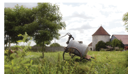
La ferme de Montaumer

7 Le pigeonnier protégeant l'entrée de la ferme de Montaumer date de 1757. Avec certains bâtiments de la ferme, c'est tout ce qui reste d'un magnifique château de plaisance du 18 e siècle détruit vers 1845. 8 Un beau panorama vers le Nord, au croisement du chemin du Clos du Roi, d'où on aperçoit en fond de vallée Montry, à gauche Esbly et en ligne d'horizon la forêt de Montgé-en-Goële. 9 Autour de la mairie : l'église Saint-Germain du 14 e siècle et le monument aux morts, œuvre du sculpteur François Cogné; la maison dite de l'Abbaye (18 e -19 e s.) cette belle demeure était l'hôtel de Giresme dans lequel a habité Madame de Chanterenne, future dame de compagnie de la fille de Louis XVI à la prison du Temple et la grande ferme ayant appartenu aux religieux de Saint-Germain-des-Près de Paris.