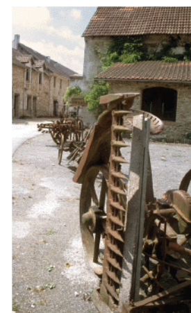
Ferme de la Petite Loge

De Sancy-les-Meaux à la Haute-Maison le plateau agricole est jalonné de fermes : la Maison Blanche, le Mans, Nesles, la Grande Rue, la Petite Loge, les Mottes, Maison Rouge, la Tavenoterie... 4 La ferme du Mans est la plus ancienne de la commune de la Haute-Maison. Cette ferme est bâtie sur l'ancien domaine du Mans, dans lequel fut édifié une chapelle par Jean et Hugues de Quincy au 13 e siècle, par la suite érigée en paroisse desservie au 17 e siècle par le curé de Villemareuil. La grange de la ferme présente une architecture remarquable avec des contreforts sur pignon et une charpente complexe à double faitage.