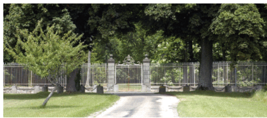
Allée du château de Vaucourtois

3 Une allée bordée de pommiers mène aux grilles du château de Vaucourtois. Cette allée est une voie privée dont le