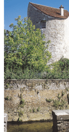
Fortifications à Crécy

brasnet du Moulin est le plus proche du Morin; on le croise avant d'atteindre l'église Saint Georges dont le clocher est fait de la tour d'une chapelle antérieure édifée au 13 è siècle. Ce brasnet formait avec la rivière une île où se situait le château, flanqué de tours, qui reçut plusieurs rois, de Philippe le Bel à Louis XII, ainsi que Jeanne d'Arc. 7 Entre les deux, le brasnet des Tanneries délimite avec chacun des précédents, deux autres îles, chacune initialement longée de murailles et de tours. De nos jours, plusieurs vannages règlent le niveau d'eau