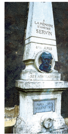
A la mémoire de A. Servin

réaliser plusieurs petits barrages dans le ravin qui domine le bourg. 10 Le monument dressé à la mémoire d'Amédée Servin, créateur du "Cercle artistique" rappelle le passé de Villiers et son église qui inspirèrent de nombreux peintres. L'Auberge du Souterrain, à Montbarbin, fut habitée par Amédée Servin. Cette auberge et d'autres dans le village, devinrent le rendez-vous d'artistes tels que Decamps, Corot, Toulouse-Lautrec ou Derain, faisant de Villiers-sur-Morin un second Barbizon, nommé "la cité des peintres de la Vallée du Grand Morin".