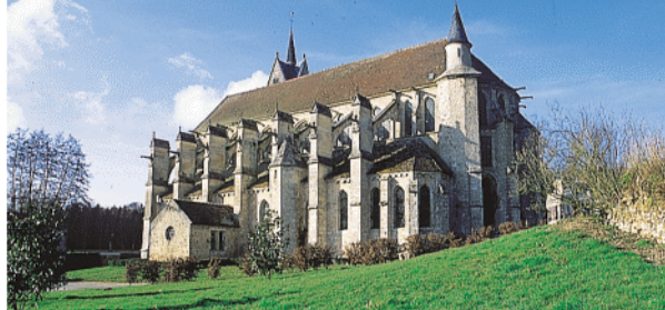
Collégiale de la Chapelle-sous-Crécy

Juste après le ru, à droite; à la route à gauche, puis au carrefour à droite. Passer le Morin, et retour au départ.