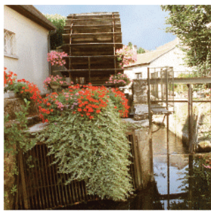
Une roue sur un brasnet

impressionnant car probablement voisin d'une quarantaine à l'origine - fit dire que Crécy était la citadelle aux 99 tours... Sur le nouveau brasnet, on observera les nombreux lavoirs, et toutes sortes de passerelles, dont bien peu ont conservé leur caractère de pont-levis dû à un ingénieux système de poulies et de contrepoids. 6 Le